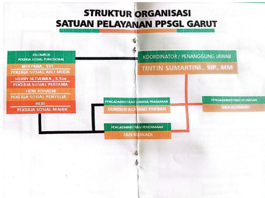
Tabel 2. Sumber Daya Manusia di Satuan Pelayanan Rehabilitasi Sosial Lanjut Usia Berdasarkan Latar Belakang Pendidikan