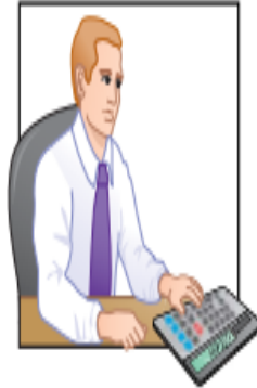
Independent Internal Verification Assistant Treasurer Makes monthly comparisons; reports any unreconcilable differences to treasurer