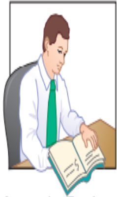
Accounting Employee Maintains cash balances per books