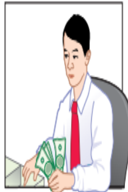
Assistant Cashier Maintains custody of cash on hand