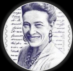
Simone de Beauvoir