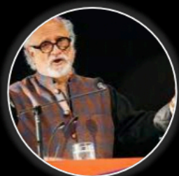
Homi K Bhabha