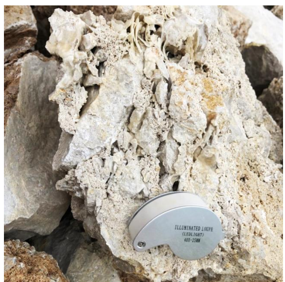
Gambar 1 (Lokasi kuliah lapangan)